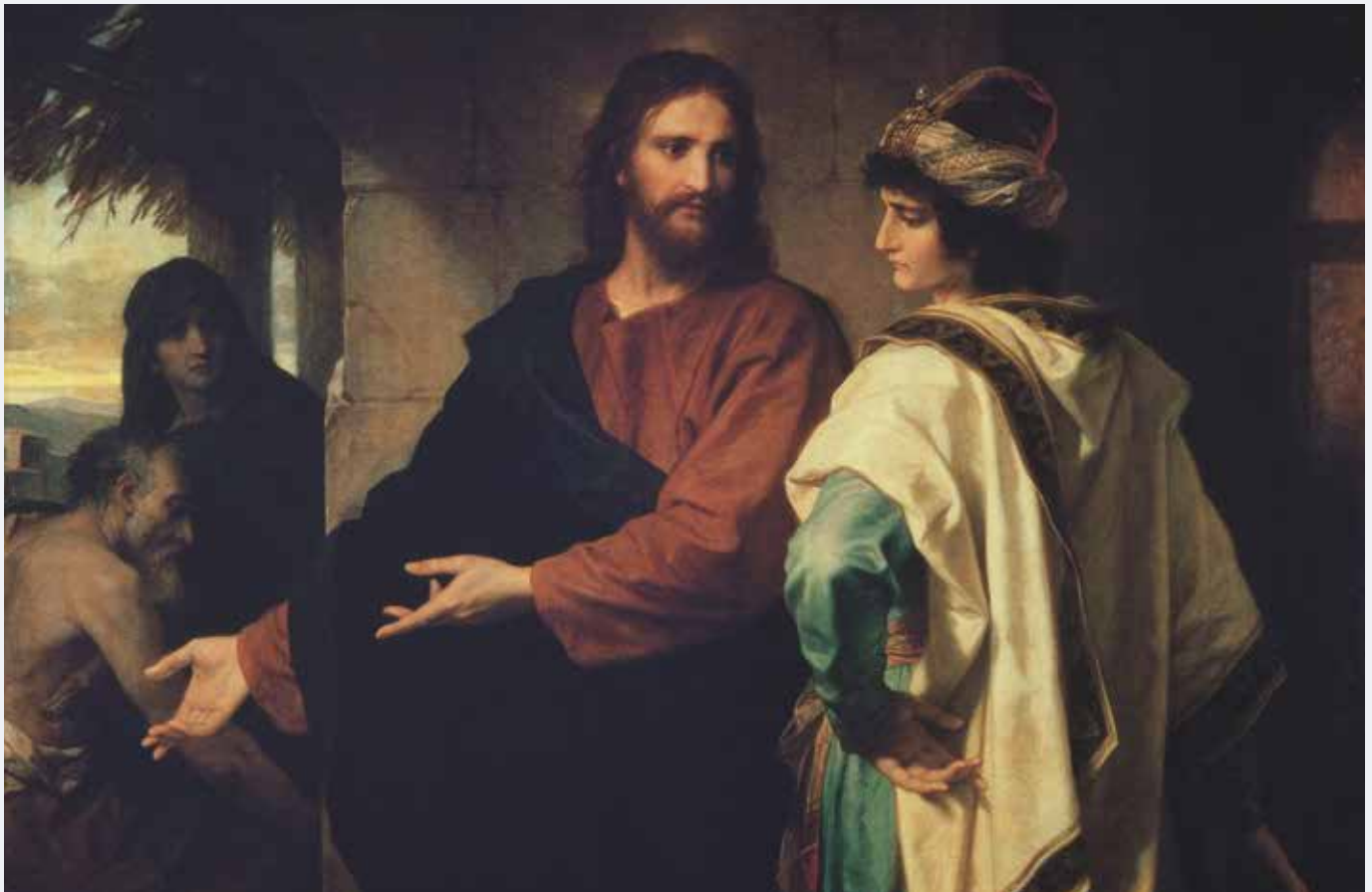
Heinrich Hofmann, Christus und der reiche Jüngling , 1889. Riverside Church, New York.

Gott, ist die Liebe zu sich selbst. Denn das erste, was Gott gemacht hat, war, dich zu lieben“ ( Memoires Domini , 3. Mai 1987, pro manuscripto ).