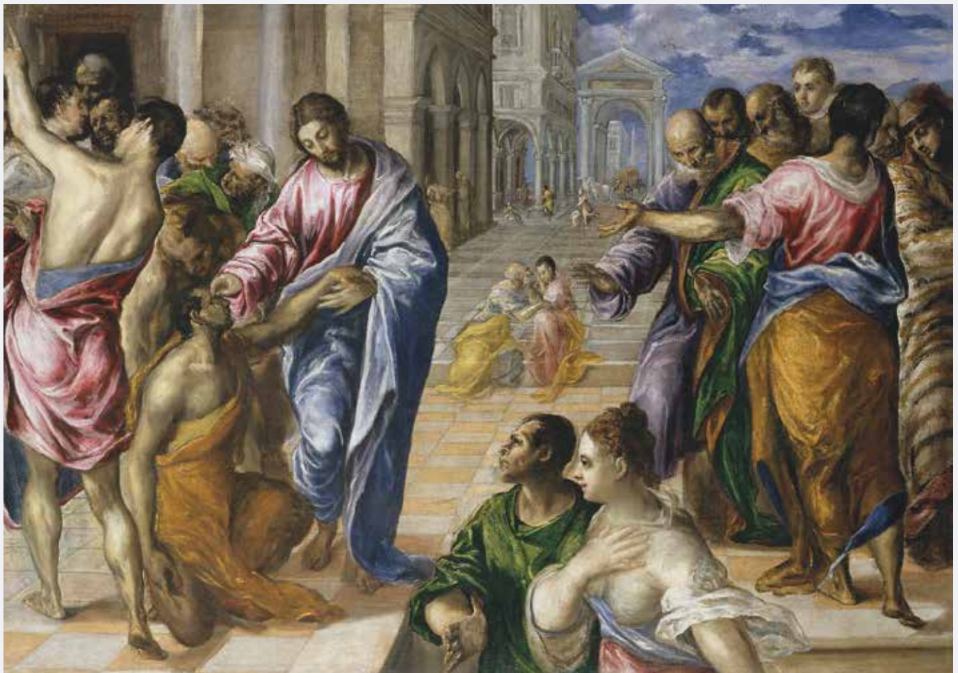
El Greco, Die Heilung des Blindgeborenen, 1570. The Metropolitan Museum of Art, New York.

Vernunft zu reduzieren, das heißt bis zur Anerkennung des Du auf dem Grund jedes Dunkels. Welches Selbstbewusstsein entstünde daraus! Welche Fähigkeit, die Wahrheit seiner selbst zu leben, und nicht immer nur durch das Dunkel bestimmt zu sein. Wir müssten nicht ständig vor dem Dunkel fliehen. Denn wir erkennen dort, am Ende des Dunkels, in der Tiefe der Wirklichkeit, in der Tiefe unserer selbst, das, was uns Bestand verleiht! Und woran zeigt sich dies? Nicht daran, dass wir andere Gedanken und Empfindungen haben. Nein! Ich erkenne es durch ein wirkliches Faktum: dadurch, dass ich neu geboren werde.